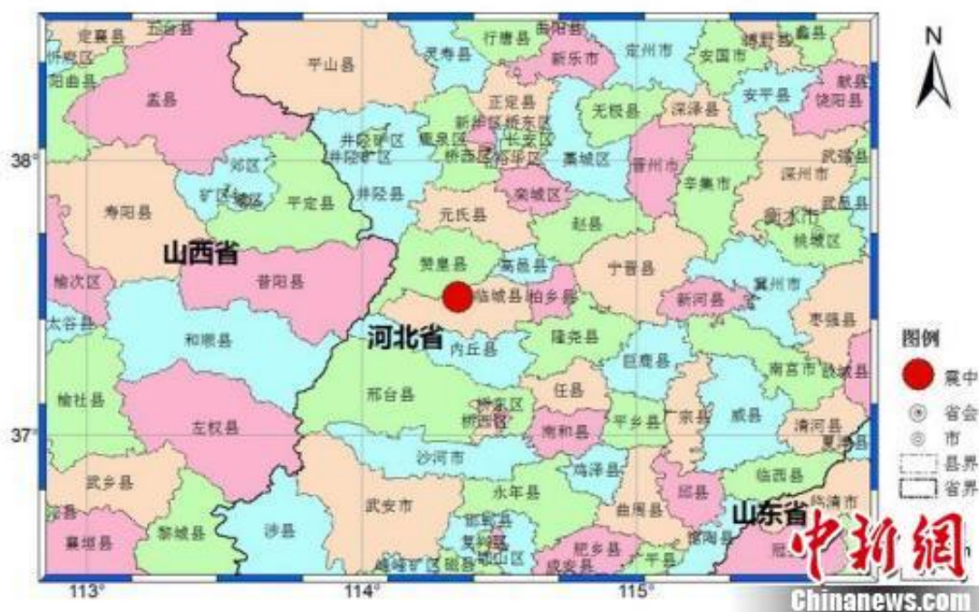
震中位置示意图。

中新网邢台9月4日电 (记者 张鹏翔 李茜)4日,中国地震台网正式测定:09月04日03时05分在河北邢台市临城县(北纬37.50度,东经114.35度)发生3.7级地震,震源深度5千米。河北邢台、石家庄部分地区以及山西阳泉市有震感。截至4时30分,共发生余震115次。地震发生后,河北省地震局立即启动IV级地震应急响应。