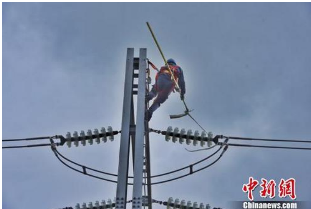
工作人员抢修在台风中受损的电力设备。

中新网佛山8月25日电 (记者 程景伟)记者25日从佛山供电局了解到,受台风“天鸽”影响,佛山全市累计196条10千伏线路跳闸,56027户用户停电,经过全力抢修,截至目前停电用户基本恢复供电,后续工作仍在紧张进行中。