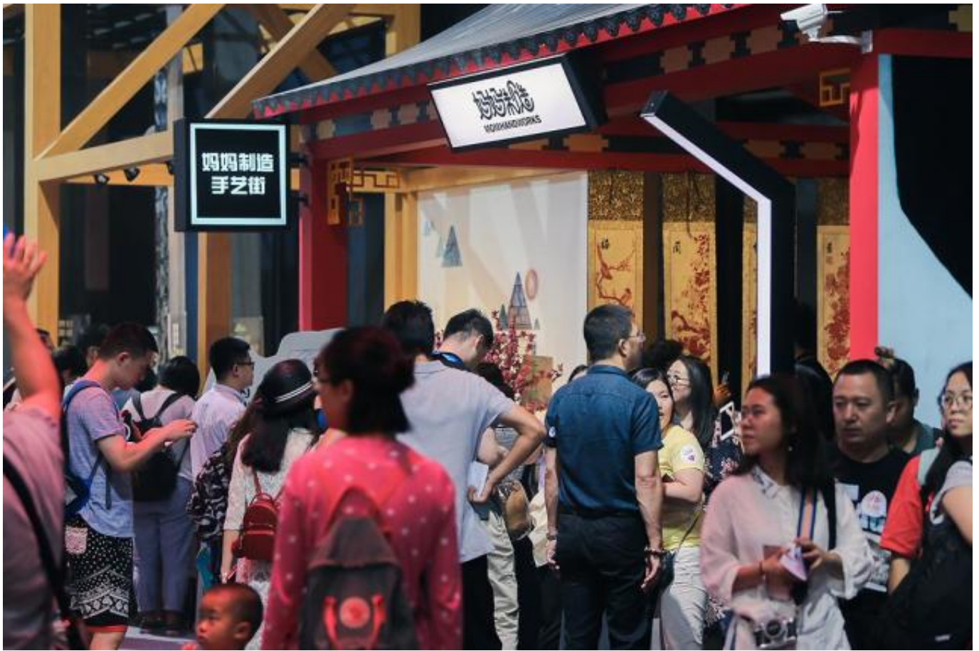
(图为“99公益市集”当日现场)