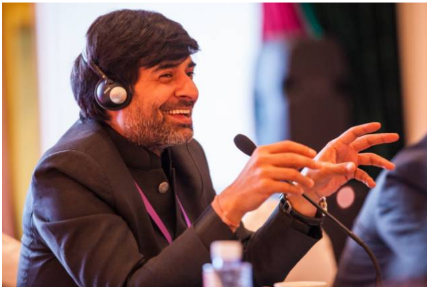
▲ 印度观察家基金会副主席萨米尔·萨兰 资料图

与受官方言论影响的一些印媒和网民相比，不少印度学者相对清醒。虽然印度观察家基金会副主席萨米尔·萨兰曾撰文称“中印冲突，中国可能输得更多”，认为如果两国开战，中国将付出声望受损和注意力转移等损失，但在一次座谈会上，他对《环球时报》记者坦言，“如果中印开战，印度必输无疑，印度不可能在与一个经济体量是其5倍的对方面前占到便宜”。