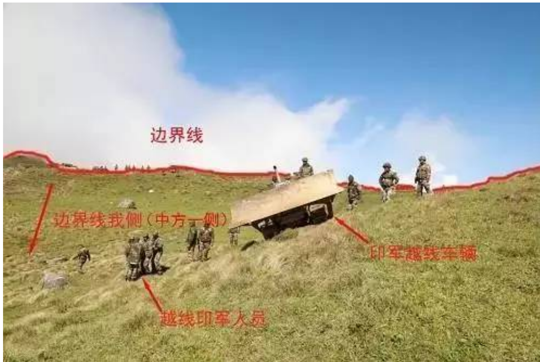
▲外交部6月29日公布印军非法越界照片，印度边防人员在中印边界锡金段越过两国承认的边界线进入中国境内。

印度记者这种模糊不清的看法或许和其官方宣传有关。继印度外长斯瓦拉吉20日宣称洞朗地区是“三国交界区”，提出印中“双撤兵”后，印度执政党人民党领导人R·K·辛格21日对印度亚洲国际新闻社表示，中国的说法是错误的，洞朗地区也牵涉印度边界，所以改变洞朗地区现状威胁印度利益，印度不能从那里撤军。