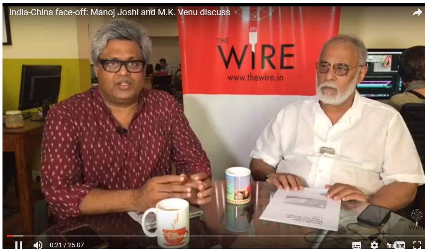
▲ 印度火线网站记者此前视频采访了印度观察家基金会资深学者马诺吉·约什