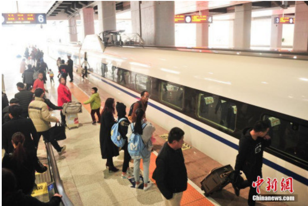
资料图：站台上准备乘车的乘客

另据媒体报道，北京西站将增加郑州、洛阳方向高峰期高速动车组列车共3对，并将北京西到西安北的一对周末线列车改为日常线，将在一定程度上缓解高峰期热门方向供需紧张的局面。