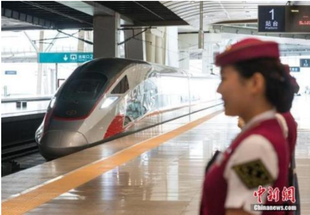
资料图：在北京南站准备出发的CR400AF“复兴号”列车。