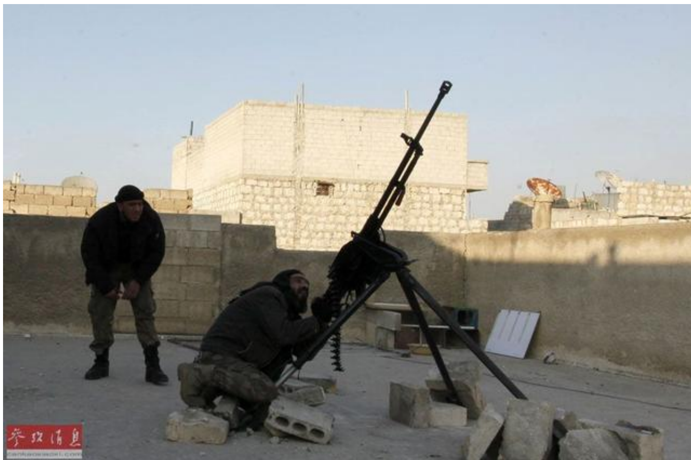
资料图：一名叙利亚“自由军”的武装人员正在操作高射机枪

参考消息网11月22日报道 外媒称，在叙利亚总统巴沙尔·阿萨德政府军收紧对叛军控制的阿勒颇东部地区的攻势之际，叛军内讧愈演愈烈，并且于14日在土耳其边界附近的一个城镇发生冲突。这一局面对政府军十分有利。