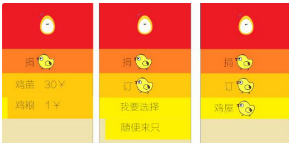
“嘴订”小程序demo效果图

为了让“养鸡”这件事变得更潮更有趣，吸引更多年轻用户的关注，萌旅还设计了一系列周边产品及漫画形象。一方面号召线上“抱鸡族”自发玩起来，一方面带动9月9日当天在成都来福士广场的“史上最全萌鸡周边展览”，号召成都市民到现场“抱走你的鸡”。