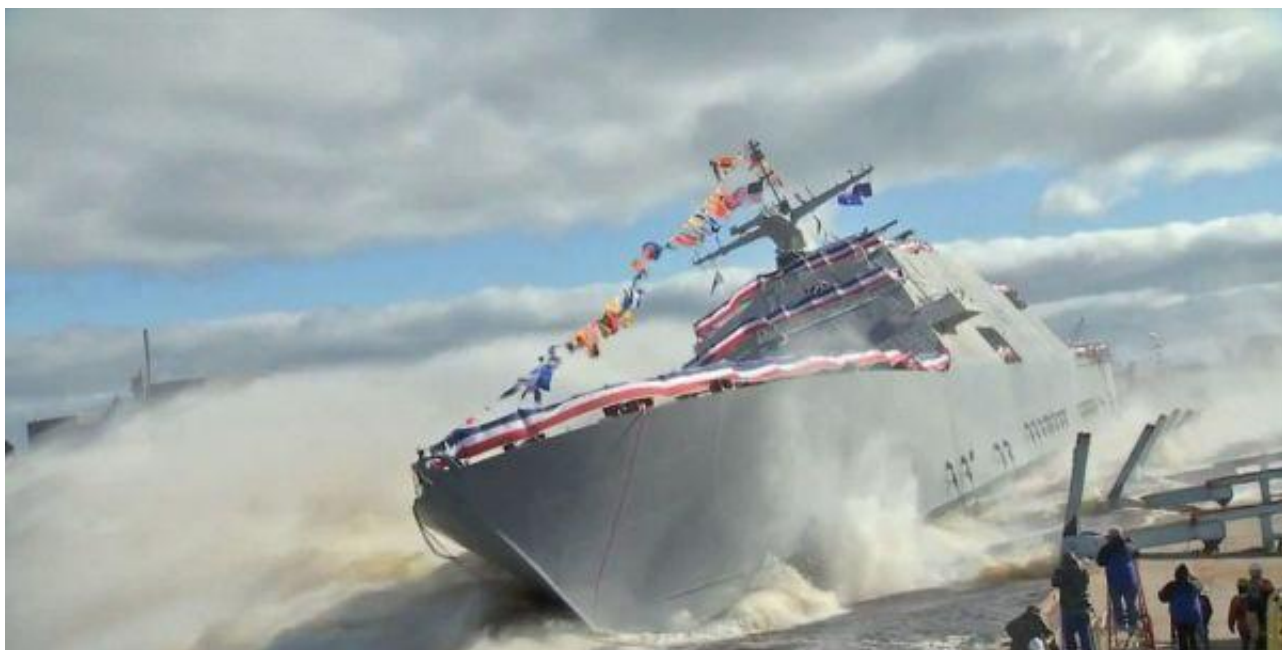
资料图：美军LCS-7“底特律”号濒海战斗舰下水

参考消息网11月21日报道 美国《国家利益》双月刊网站11月14日发表题为《12艘航母和350艘军舰：当选总统唐纳德·特朗普提出的战略道路》的文章，作者为新美国安全中心防务战略与评估项目负责人、高级研究员杰里·亨德里克斯，编译如下：