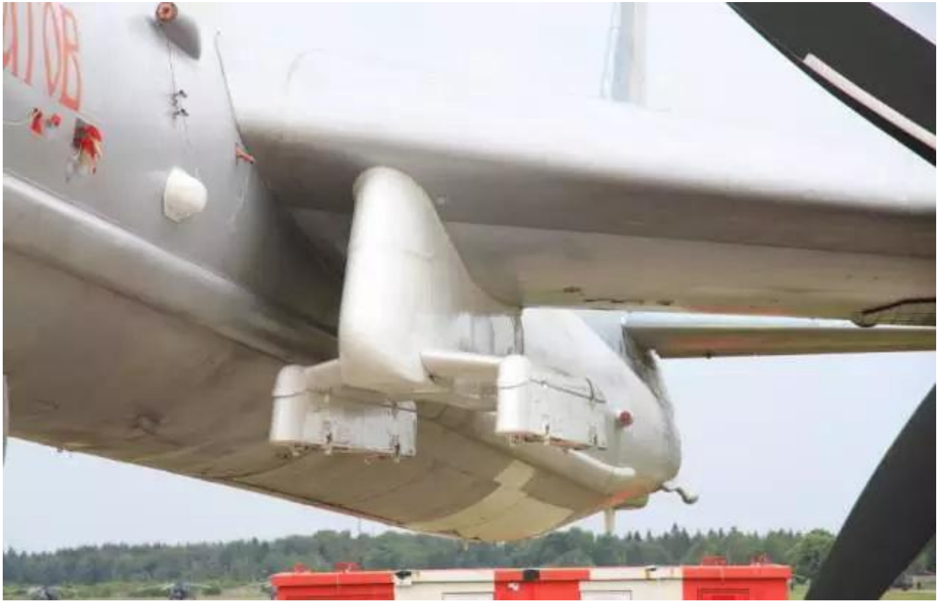
图：图-95MSM的专用挂架特写

值得注意的是，俄军称图-95MSM在行动中经过了2次空中加油，图-95不是号称航程超一万公里吗？怎么要加2次油？这背后涉及到一个问题——外挂导弹令图-95的航程大打折扣。