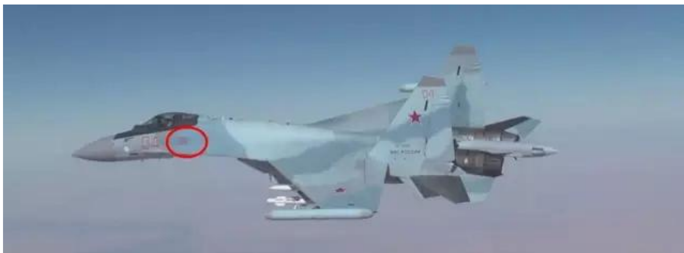
图：视频中的“红色04”号苏-35S，注意左侧前机身的星，应该有35-40颗