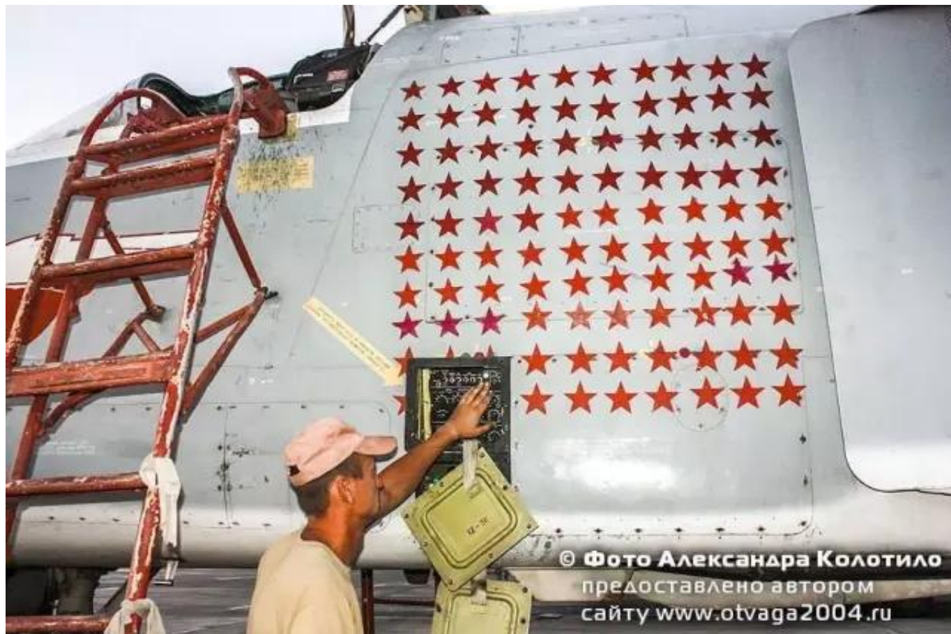
图：这架苏-24前线轰炸机在叙利亚的出动架次达到了惊人的1000架次

苏-35S护航并不稀奇，但飞机上的一个细节却值得注意，视频画面显示苏-35S机身上已经被涂上了至少35-40颗红星。