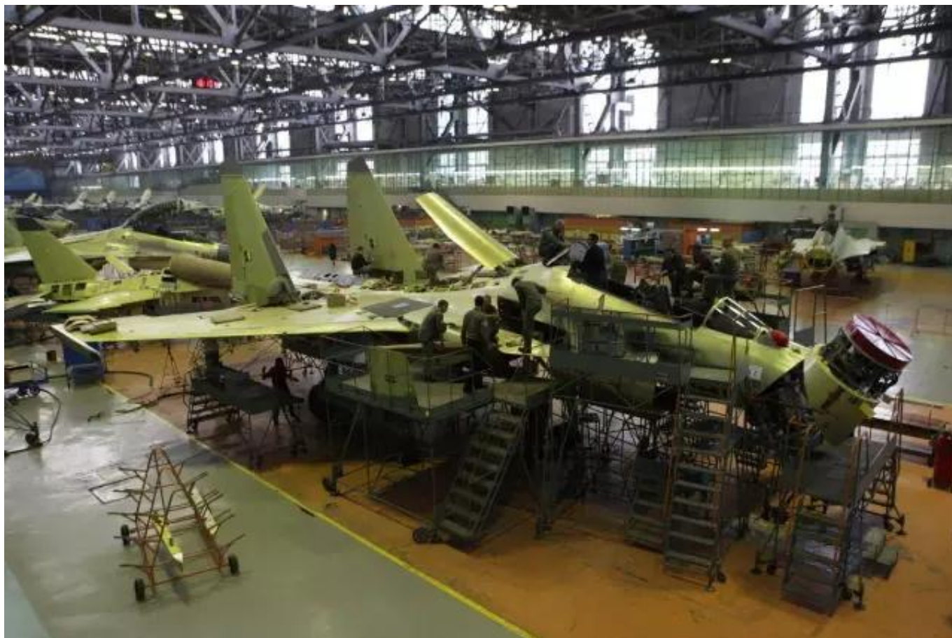
图：今年以往的苏-27/30维修雷达需要上翻雷达

苏-35S可维护性方面，前起落架舱就是一个典型例子。以往苏-27系列雷达的维护需要将雷达上翻而后将雷达前移，而维修苏-35S的“雪豹”-E火控雷达只需通过打开前起落架舱机首方向的舱门和机首侧面舱门即可，这大大简化了作业量。此外，通过前起落架舱还可以对其它一些航电设备进行简单维护。