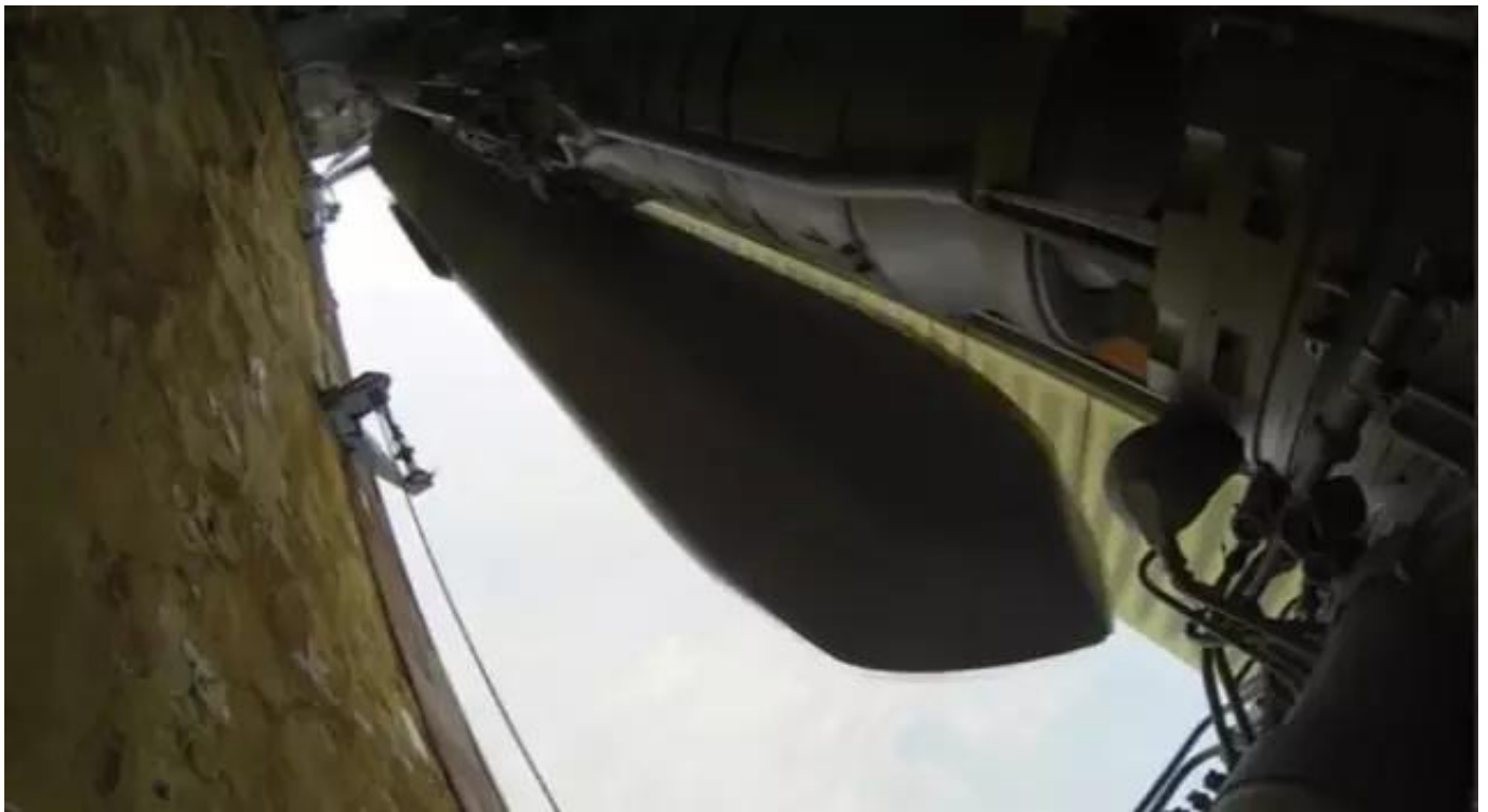
图：去年图-160在对叙行动中发射Kh-101

在这一背景下，2015年11月17-20日的连续4天，俄罗斯空天军出动5架图-160和6架图-95MS战略轰炸机，向位于叙利亚的极端组织怒射48枚Kh-101和35枚Kh-555常规战略巡航导弹。