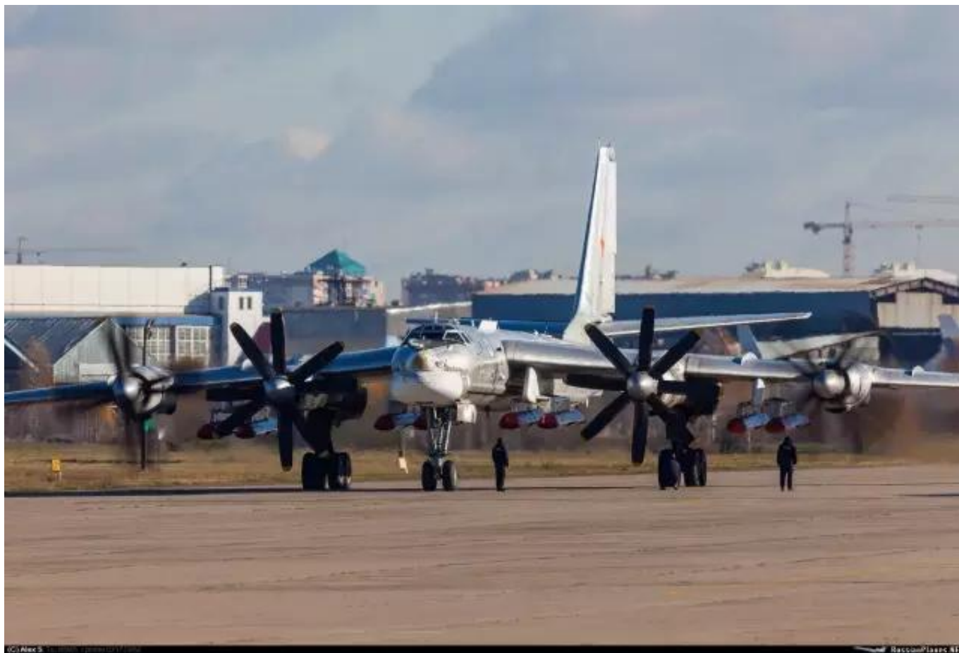
图：图-95携带8枚Kh-101/102的样子，阻力可想而知

具体会如何影响呢？北国防务（微信ID: sinorusdef）认为，这或许可以参照图-142，根据官方公开的信息，图-142在外挂6枚重600千克的Kh-35反舰导弹时，航程将下降20%；在外挂6枚重约2500千克（与Kh-101/102类似）的“宝石”/“布拉莫斯”反舰导弹时，航程将下降40%。以此推测，图-95在外挂8枚Kh-101/102时，其航程很可能只有7000千米（无外挂时航程约10500千米）。