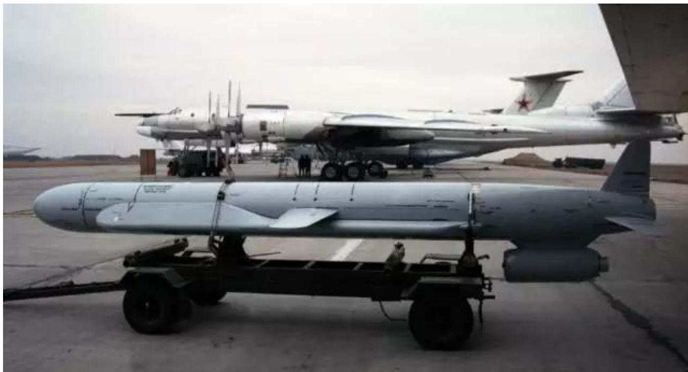
图：2003年前，带保形油箱的Kh-55SM是图-95的主要武器，主要用于核威慑

在适配Kh-555的同时，图-95也在进行适配Kh-101/-102新型导弹的工作。因为图-95的弹舱小无法容纳Kh-101/102，相关的改进工作较大，这也就是现在的图-95MSM。