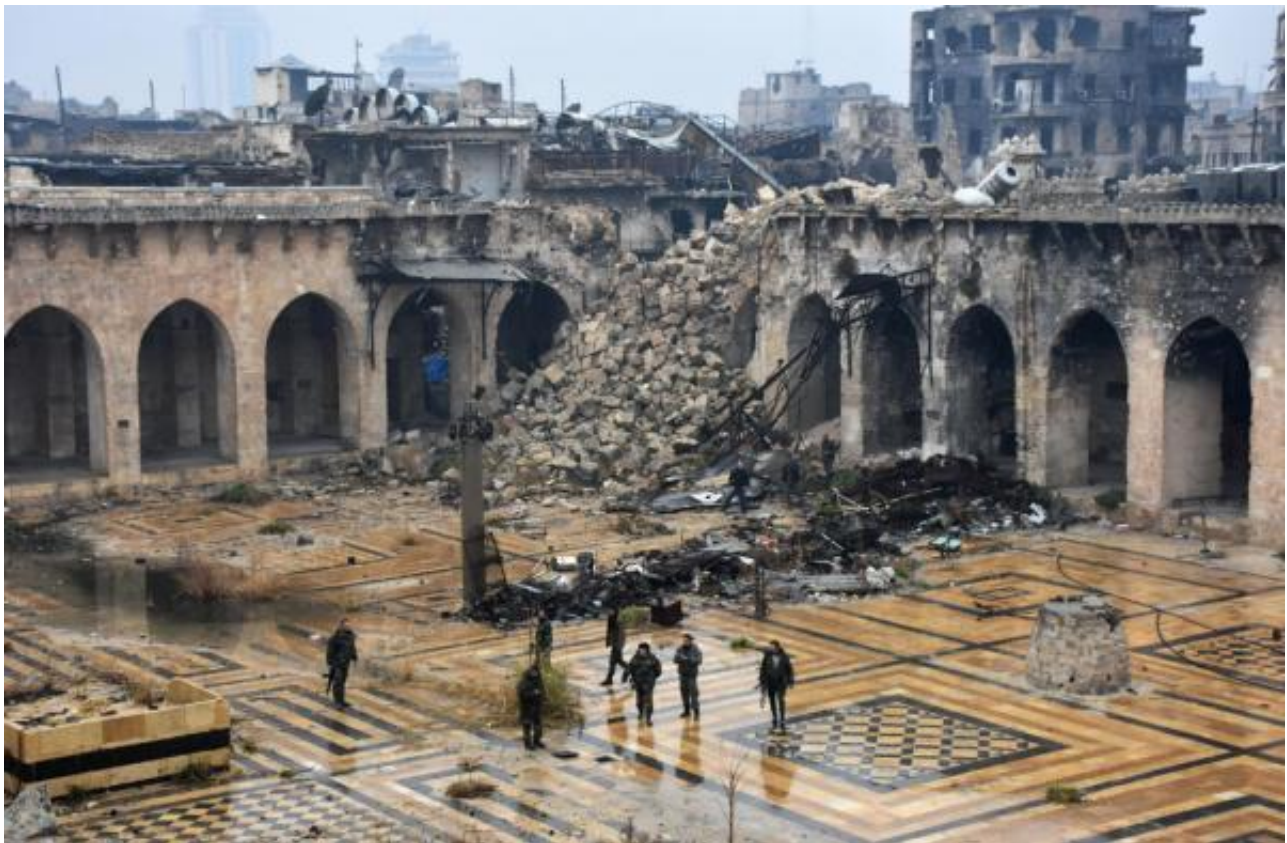
13日，叙利亚政府军进入倭马亚清真寺

据“德国之声”报道，俄罗斯常驻联合国代表丘尔金 (Vitaly Churkin) 13日深夜表示：“（叙利亚政府军和反叛武装）已达成协议，让反叛武装撤离阿勒颇。”叙利亚城市阿勒颇东区的所有军事行动已经停止，叙利亚政府已经控制了该地区。