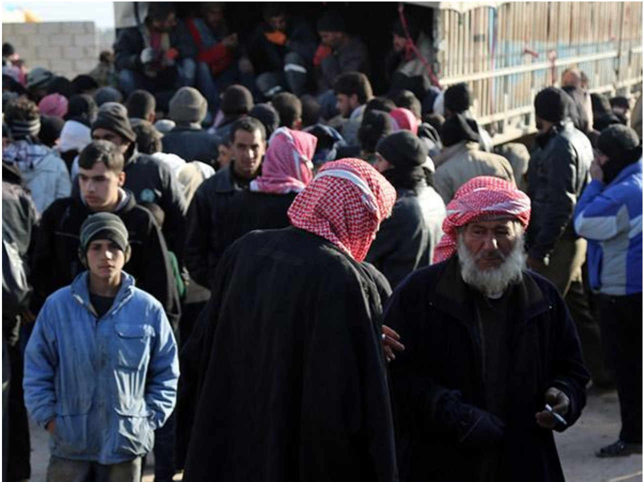
部分阿勒颇难民将前往土耳其安置