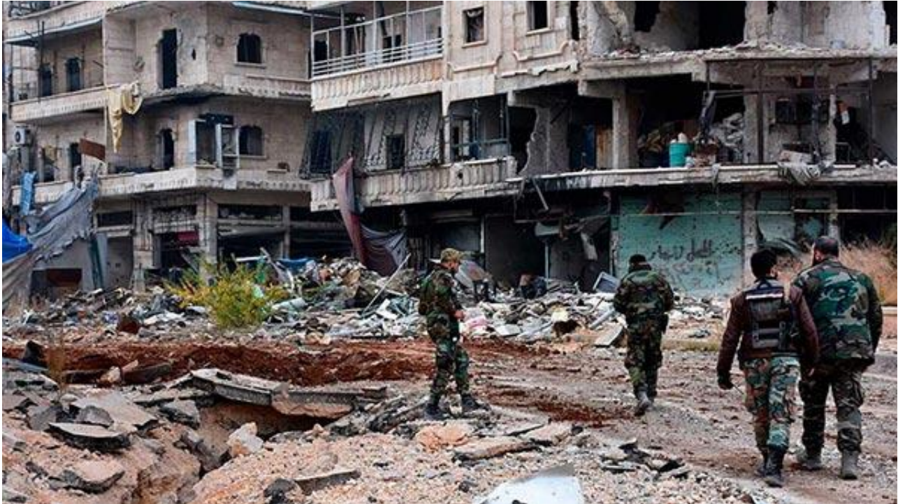
叙利亚政府军进入城区

据新华社14日报道，叙政府军中将扎伊德·阿勒萨利赫是叙政府设立的阿勒颇安全委员会负责人。他在政府军12日收复的谢赫·赛义德区对媒体记者说：“在阿勒颇东部的战事已进入最后阶段，他们（反对派武装）没有多少时间了。他们要么投降要么受死。”