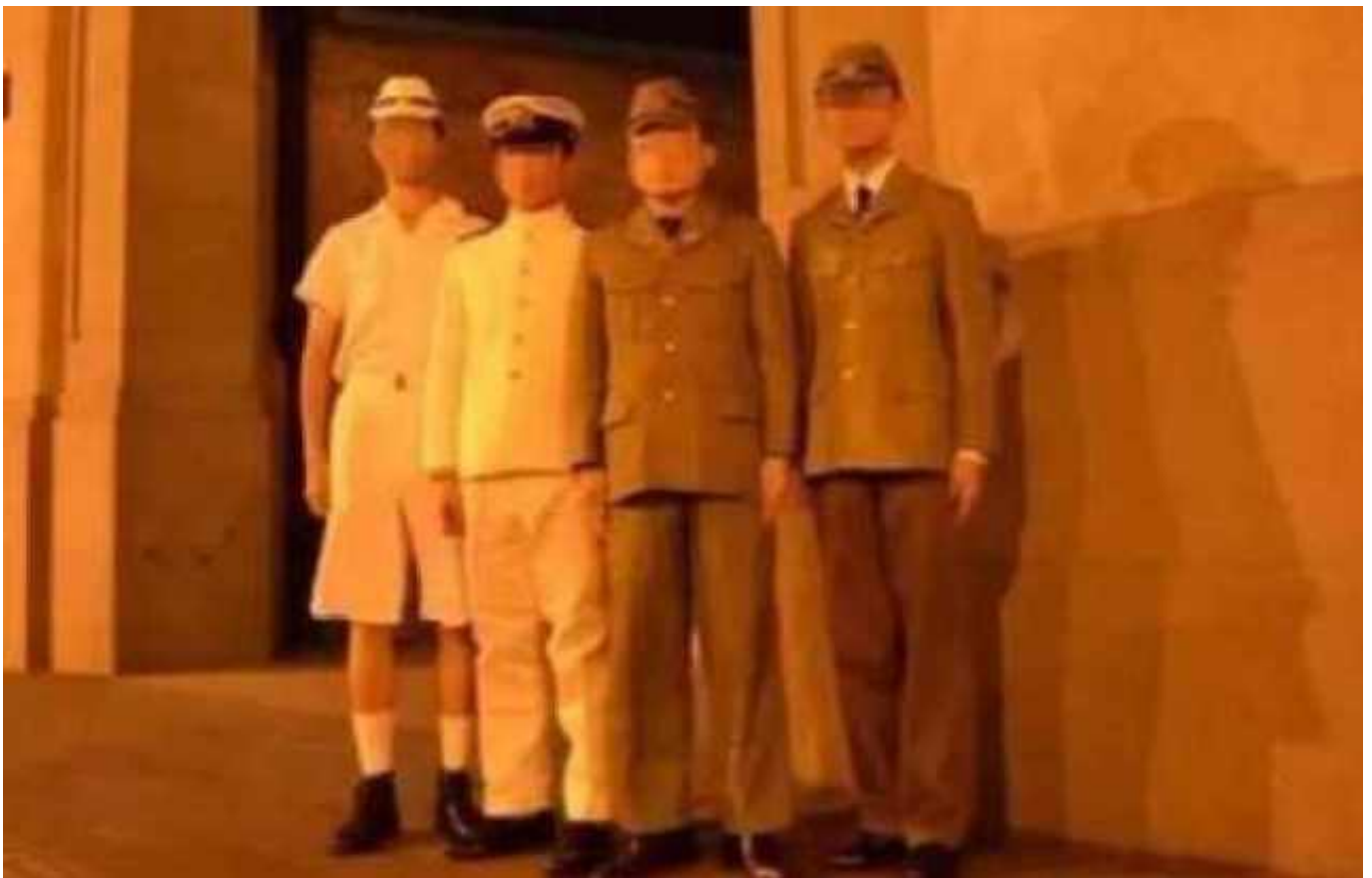
4名男子穿日军军服在四行仓库拍照。网络图片