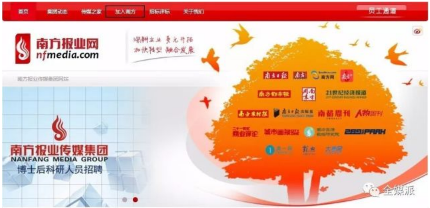
位于首页菜单栏的招聘入口（以南方报业传媒集团为例）