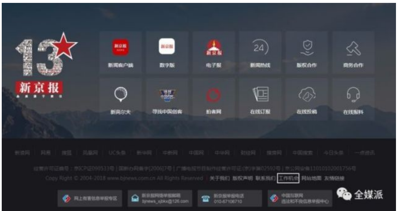
位于首页底部的招聘入口（以新京报社为例）

同时，不少单位都特别开设了校招/招聘网站，不仅岗位信息齐全，而且还提供招聘时间、招聘要求、招聘会地址等附加信息的说明。在求职路上，不妨尝试搜索“单位名+校招/招聘”，看看你心仪的单位有没有开通这种渠道。