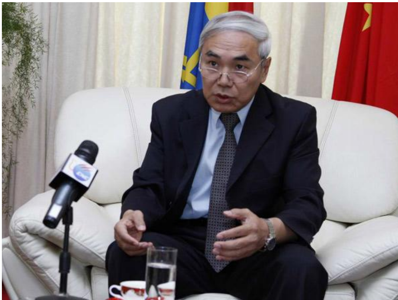
资料图：中国政府叙利亚问题特使解晓岩

此外，解晓岩日前在大马士革接受新华社专访时表示，中国在叙利亚问题上历来公正客观，当前叙局势处于关键、敏感时期，安理会应努力凝聚共识，保持团结，形成合力，避免制造矛盾争端。