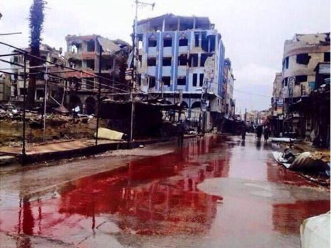
外媒照片：叙利亚血流成河

对阿勒颇的4点人道主义援助计划，让食品和药物进入这座受困的城市，伤病员得以疏散出去。目前，反对派武装组织已经签署协议。