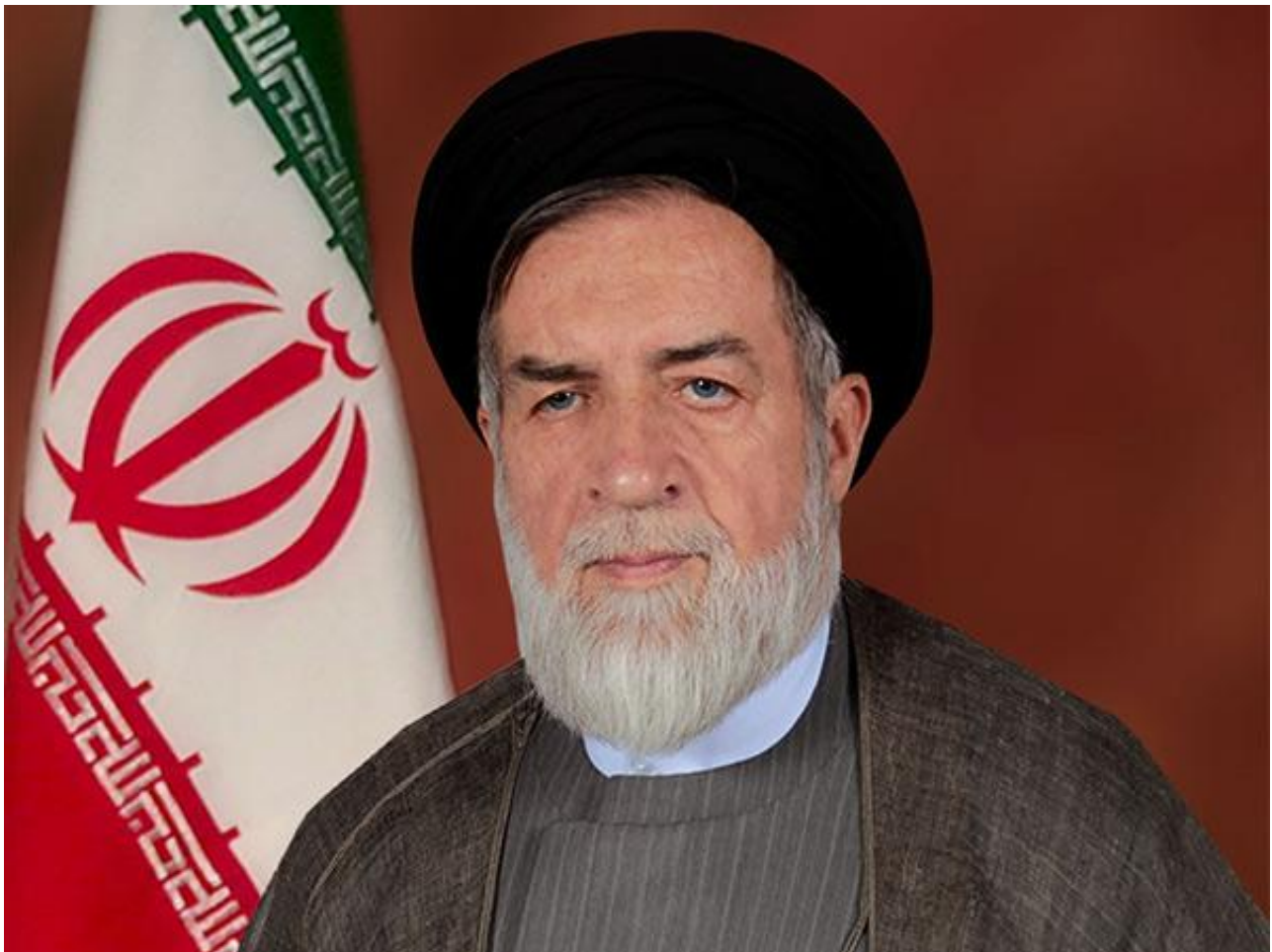
资料图：伊朗副总统兼烈士及退伍军人基金会主席萨希迪

据路透社11月22日报道，伊朗副总统当日首次承认，派往叙利亚的军事顾问和志愿军阵亡人数累计已经超过1000人。黎巴嫩真主党武装的损失据称更为巨大。而俄罗斯在军事上的短板已在连续两起航母事故中逐渐暴露，那么他们是否能顶住压力，又会不会敦促叙政府妥协呢？