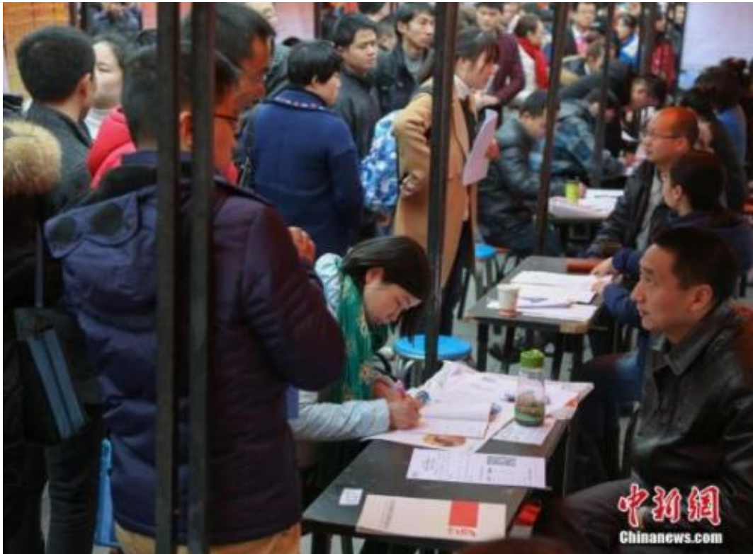
资料图：在武汉市纳杰人才市场招聘会上，挤满了前来应聘的求职者。