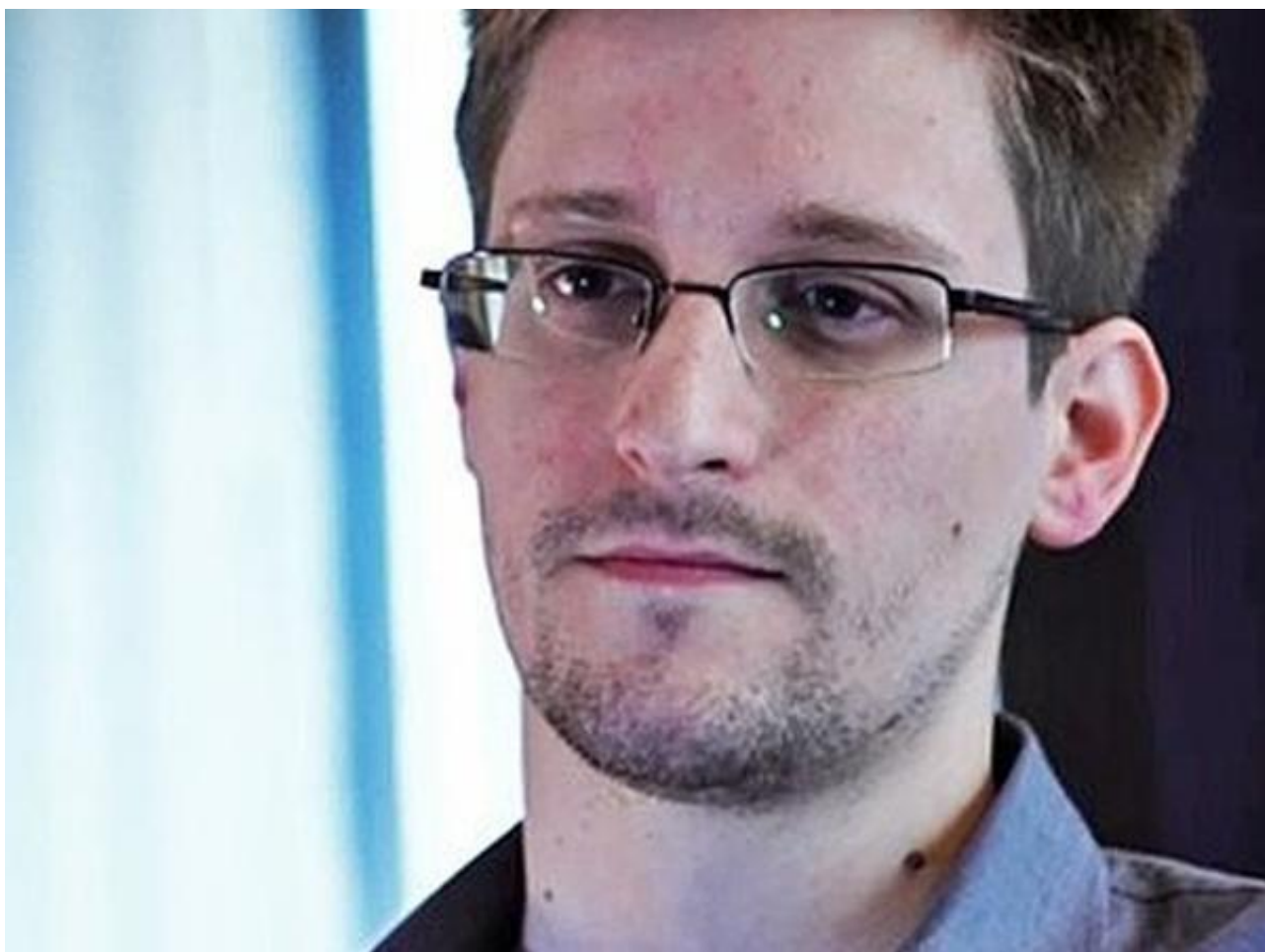
斯诺登曾多次透露美国的网络攻击计划

【观察者网综合】近日，继日本自卫队网络遭受黑客攻击后，俄罗斯和沙特阿拉伯的金融机构也遭到了网络攻击。俄罗斯央行官员2日称，该行代理账户遭黑客袭击，被盗取了20亿俄罗斯卢布(约合3100万美元)资金。而彭博社1日报道，沙特阿拉伯遭到“可能”有伊朗政府背景的黑客的袭击，多个不同网络部位的“网络炸弹”被同时引爆，造成数据丢失、国家机场管理系统瘫痪等后果。