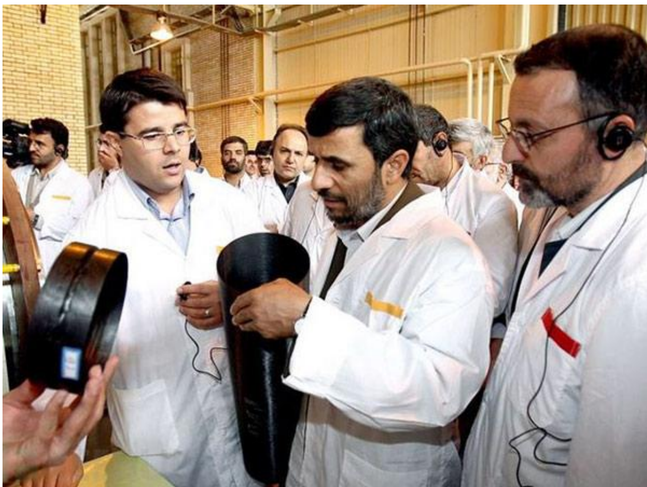
2010年伊朗核设施遭“震网”病毒攻击

2012年6月美国《纽约时报》高调披露，“震网”病毒起源于2006年前后由美国前总统小布什启动的“奥运会计划”。2008年，奥巴马上任后下令加速该计划。