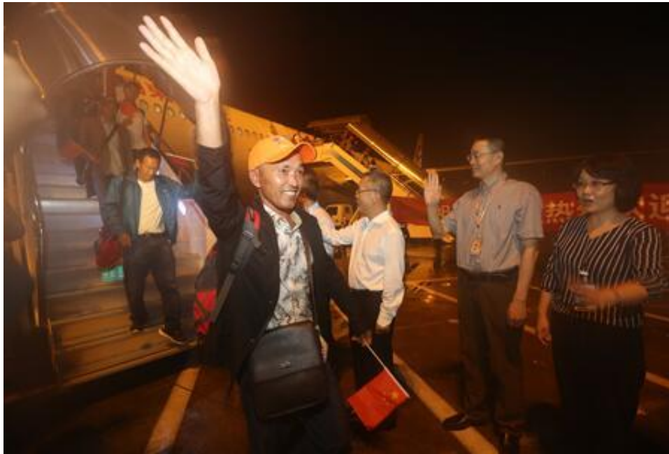
东航包机顺利降落虹桥, 受灾同胞挥手致谢。