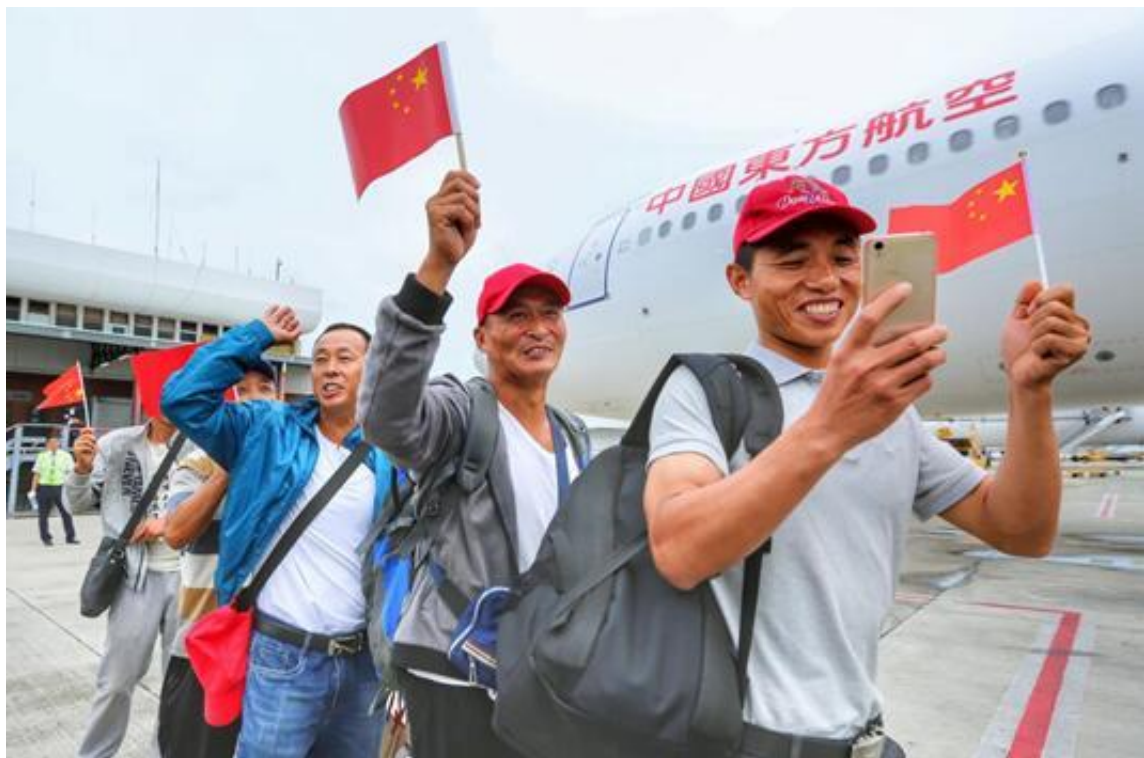
第一批220名受困同胞激动地挥舞国旗，准备登机。