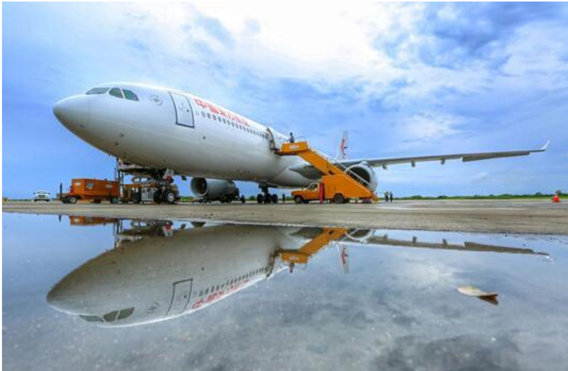
最终，飞机在同胞的翘首以盼中成功降落维尔·伯德机场。