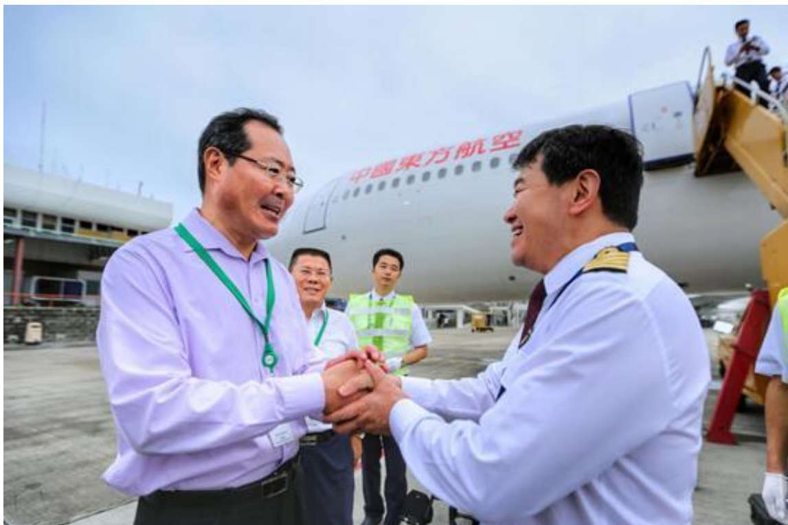
“看到你们的飞机到了，我就放心了！”中华人民共和国驻安提瓜和巴布达特命全权大使王宪民率领使馆人员早就在停机坪等待包机到来。