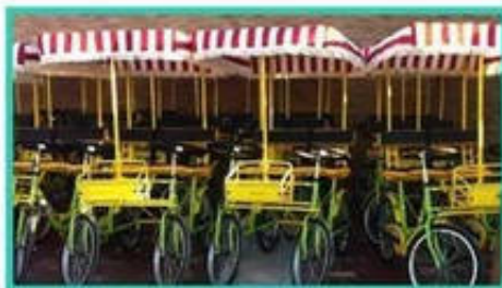
✘ 抢占传统租赁业务

“共享单车”推出仅仅一年，迅速火爆全国，但到目前为止，仍然属于简单粗暴、利益独享的“1.0共享单车”模式。虽然给百姓出行提供了便利，但却引发乱停乱放、强占路道等恶性问题，尤其对各大旅游景区形成极大冲击，造成门口凌乱、景区挤爆甚至交通瘫痪，不仅大煞风景，还增加了旅游景区的很多管理负担。