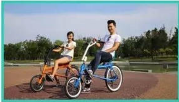
单人骑A1--自行车中的SUV 更快速更拉风，5-100公里远游完胜