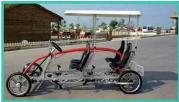
多人骑--3-5口之家休闲观光 微躺一开，欢乐开怀！

首先，与各地景区共赢。E骑游将负责提供单车、智能锁、扫码租赁等整套共享单车系统，即让当地商家获得共享单车服务，实现租车业务升级，又给景区游客提供租车便利。