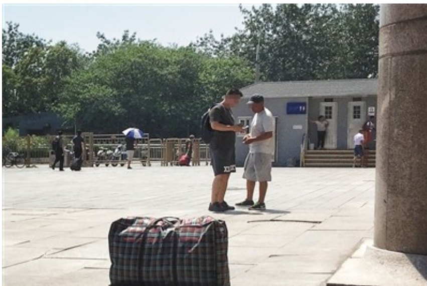
7月7日，北京西站，黄牛和乘客交易火车票。