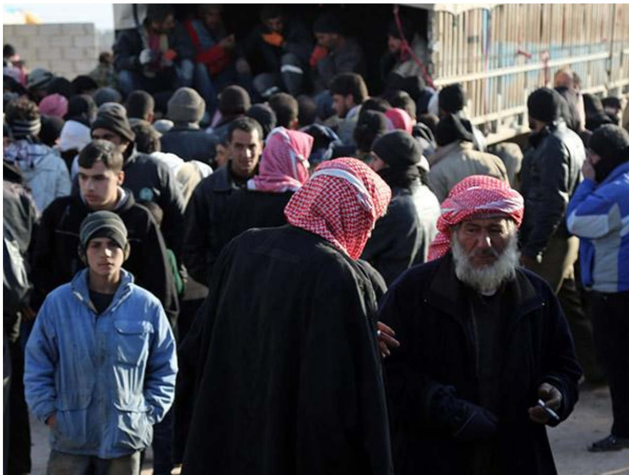
部分阿勒颇难民将前往土耳其安置