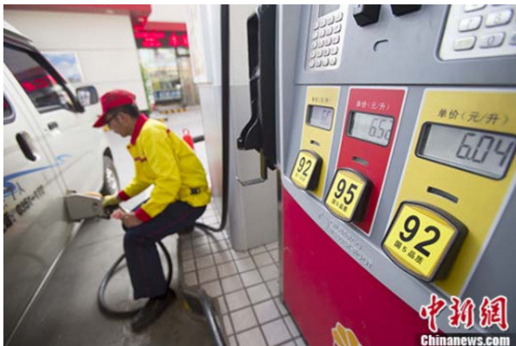
资料图：山西太原，加油站工作人员给车辆加油。

中新网北京9月29日电 (记者 程春雨)新一轮成品油调价窗口将9月29日24时开启。多家机构预测，国内油价将迎来“二连涨”，或创年内最大涨幅。油箱50升的私家车加满一箱油料需多花超7.5元，“十一”长假有出行计划的车主可29日(周五)24点前提前加油。