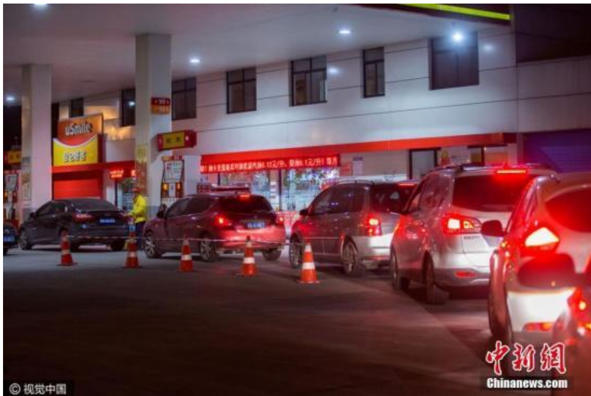
资料图：2016年12月14日，杭州市众多车主在加油站排队加油。