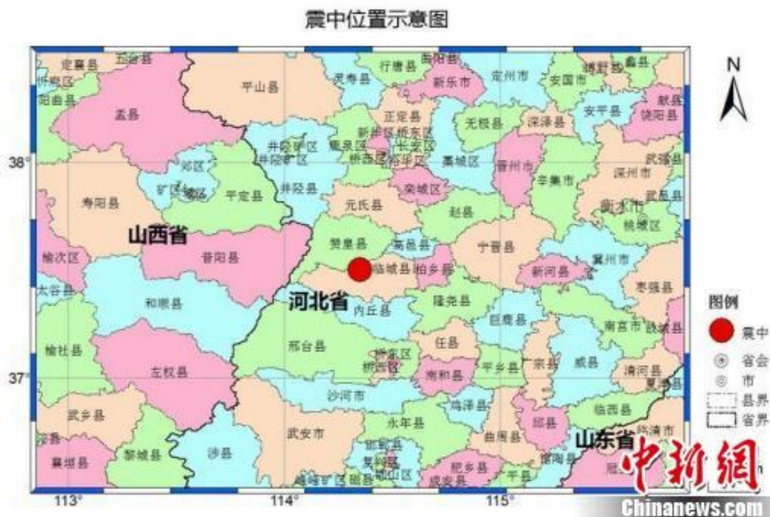
震中位置示意图。

中新网邢台9月4日电 (记者 张鹏翔 李茜)4日,中国地震台网正式测定:09月04日03时05分在河北邢台市临城县(北纬37.50度,东经114.35度)发生3.7级地震,震源深度5千米。河北邢台、石家庄部分地区以及山西阳泉市有震感。截至4时30分,共发生余震115次。地震发生后,河北省地震局立即启动IV级地震应急响应。