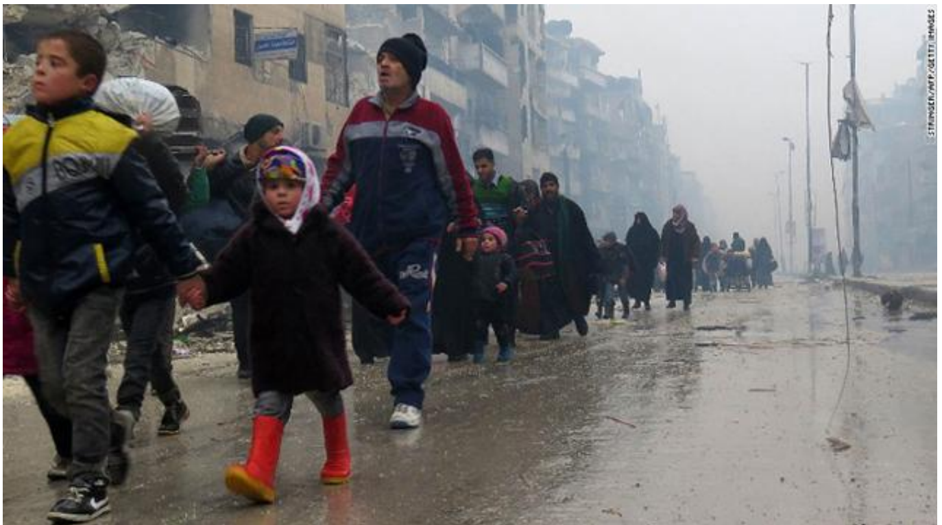
叙利亚难民

而土耳其的考虑更为复杂。其总理埃尔多安为了与俄罗斯修复关系已经付出了巨大努力, 但受到其支持的叙利亚温和反对派武装正在“伊斯兰国”在叙北部“首都”拉卡(Raqqa)附近扩张势力。埃尔多安最近曾表示他仍然认为阿萨德应该下台, 但他的调门似乎已经有所降低。