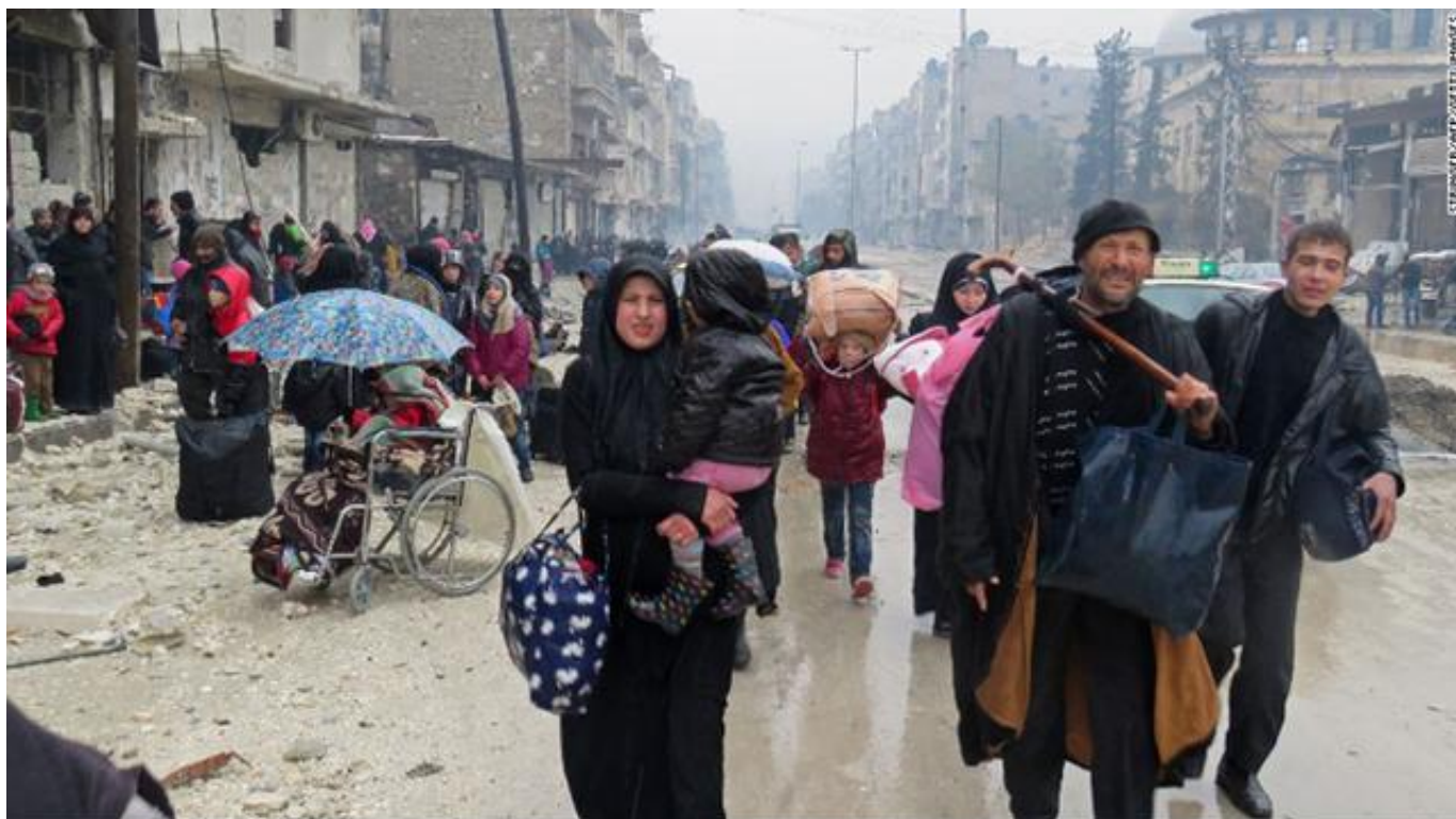
叙利亚难民

CNN报道称，战争已经进入了新的阶段，阿萨德政权正在试图巩固战果。一直以来，平复内战伤痛、使难民重返家园的希望都十分渺茫。长期的战乱使阿萨德政权即将统治的国家只剩下一片废墟。