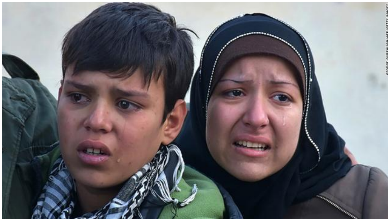
叙利亚难民

即使如此，CNN报道称，现在政治解决叙利亚问题已经不再现实。阿萨德政权已经不可能做出任何妥协，他现在也没有与别人做交易的动力。即使在2015年战局最焦灼的时期，阿萨德也未选择妥协，何况现在是自2011年以来国际环境对其最为有利的时候。