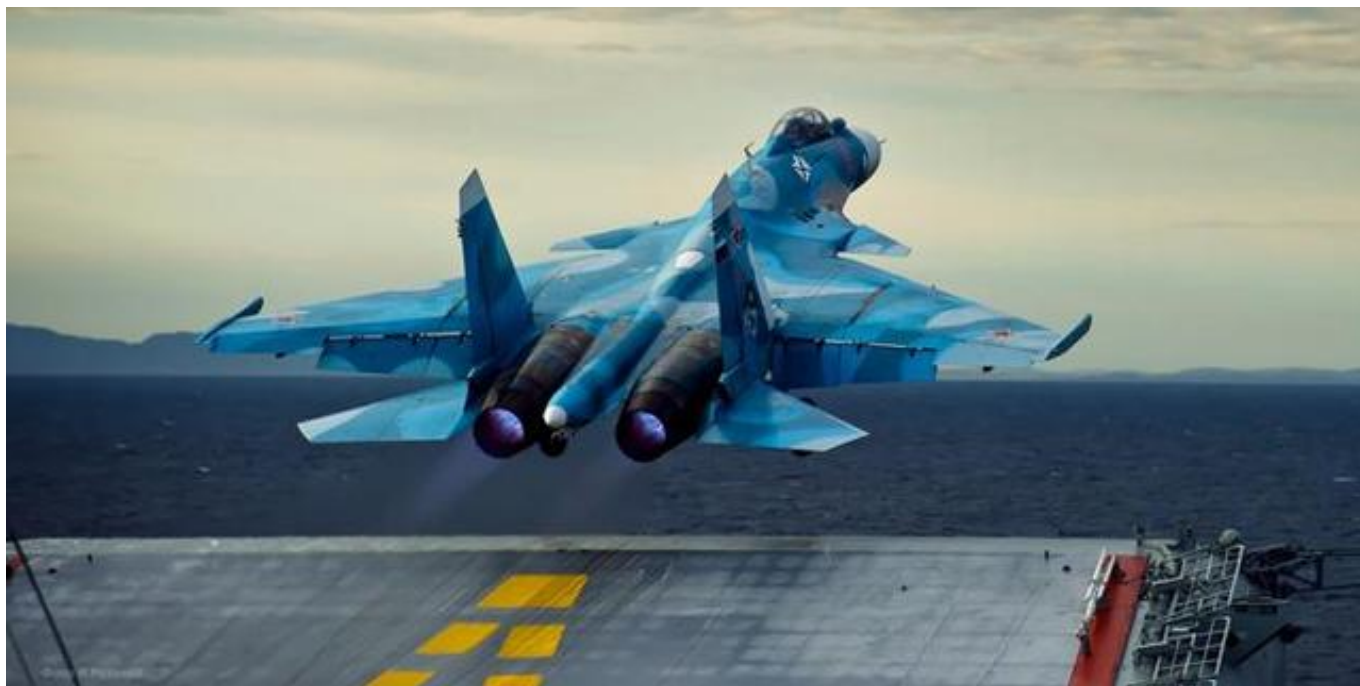
俄罗斯国防部公布的苏-33舰载机从“库兹涅佐夫”号航母上起飞的画面

12月5日，美国《航空家》网站报道称，美国国防部消息源透露，俄罗斯海军一架苏-33舰载机在12月3日试图在“库兹涅佐夫”号航母上降落时坠入地中海。