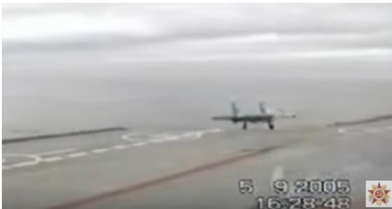
（资料图）2005年时一架苏-33舰载机因阻拦索断裂坠海

俄罗斯“库兹涅佐夫”号航母这次出击叙利亚从一开始就被负面消息纠缠，西方国家嘲讽冒着黑烟的俄罗斯航母是“重演第二太平洋舰队悲剧”（日俄战争期间俄将波罗的海舰队调往远东作战，结果遭到惨败）。继上月一架米格-29KUBR战斗机因航母阻拦索故障难以修复，耗尽燃油坠毁之后，12月3日，又一架俄罗斯苏-33舰载战斗机坠毁。事故原因据称是着舰时阻拦索断裂，飞行员弹射逃生，相关报道已经得到俄罗斯国防部确认。这次事故表明，俄罗斯“库兹涅佐夫”号航母确实存在带病参战的问题，其阻拦索系统很可能存在设计缺陷。中国“辽宁”号的阻拦系统是我国自行研制，与俄航母不同。