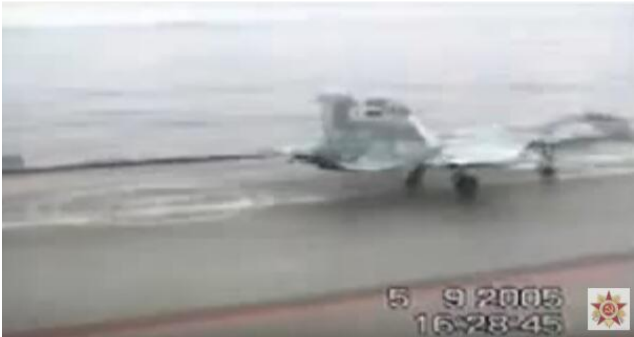
俄罗斯唯一的航母“库兹涅佐夫”号的阻拦索似乎并未彻底解决长期存在的技术问题